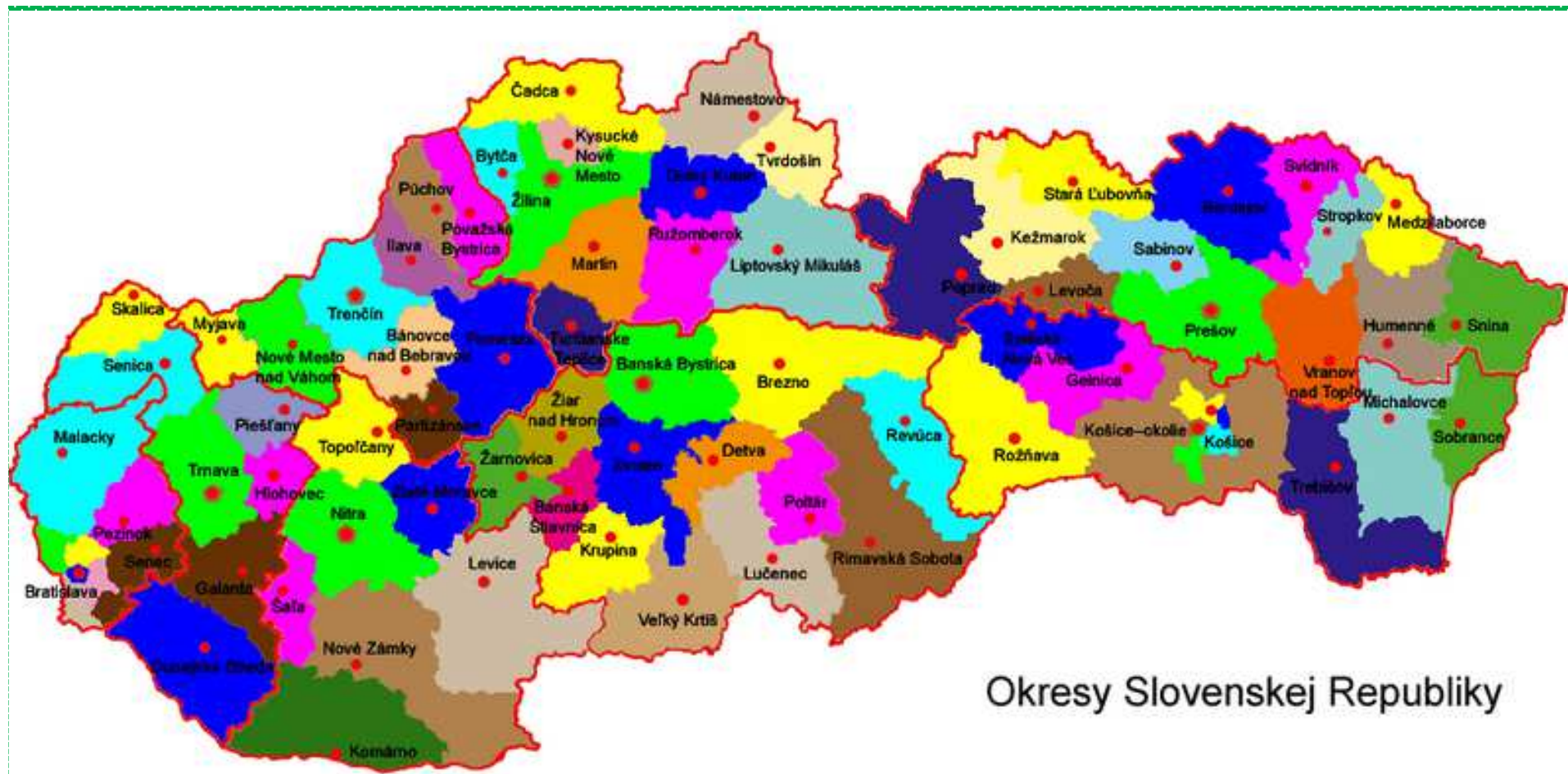
Okresy Slovenskej Republiky

Veľký Krtíš, Lučenec, Poltár, Rimavská Sobota, Revúca, Rožňava, Kežmarok, Sabinov, Svidník, Vranov nad Topľou, Trebišov, Sobrance